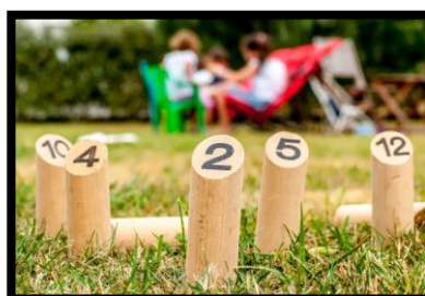
Jeux Plein Air